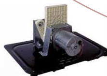
Mécanique en céramique pour une plus grande fluidité et fiabilité

Le flux énergétique généré par le mouvement elliptique qui prend naissance dans les pieds et les chevilles et circule dans tout le corps a de nombreuses répercussions sur la santé de l'être humain.