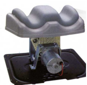
Appui chevilles, de haute qualité, rembourré et confortable

Le Chi Vitalizer est équipé d'un moteur d'une puissance de 45 watts et d'une grande longévité, il est confortable et très peu bruyant.