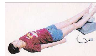
Une des 4 positions de base sur le Chi Vitalizer

De nombreux utilisateurs et professionnels de la santé considèrent que le régulateur de vitesse du Chi Vitalizer est un atout essentiel qui permet de pouvoir démarrer et utiliser l'appareil en toute sécurité, avec un maximum de confort, c'est-à-dire en respectant la sensibilité et l'état de santé de chacun, notamment pour les personnes souffrant d'inconfort musculaire et articulaire.