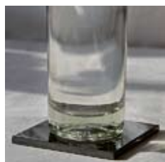
Plaque de schungite polie de 10x10 cm

La plaque de schungite permet de dynamiser l'eau de manière intéressante. Lorsque nous posons un objet dessus (carafe d'eau, verre, aliment, remède), nous pouvons observer une augmentation très sensible du taux vibratoire de l'objet. Il est aisé d'évaluer cette transformation à l'aide d'un pendule et d'une échelle Bovis. D'après les radiesthésistes, la vitalité moyenne de l'être humain est égale à 6500 bovis. Pour qu'un aliment, un objet, un lieu de vie soit bénéfique à l'être humain, sa vibration doit être supérieure à 6500 bovis. Nous pouvons tester l'eau de la même manière.