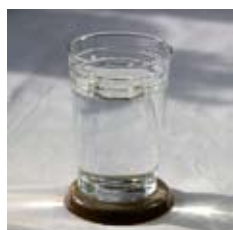
Verre d'eau dynamisée sur un palet Bien-être

Nous recommandons de poser un récipient d'eau sur le palet « Bien-Être » et d'éviter un contact direct entre le palet et l'eau. Les informations d'harmonisation, anti-stress et de récupération portées par le palet vont se communiquer à l'eau par résonance énergétique.