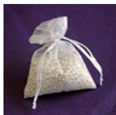
Precious Prills Sachet de 60g d'oxyde de magnésium énergisé

Nous proposons un produit de base, les Precious Prills , vraiment accessible à tous et dont l'action dure plusieurs années. Ce sont des fragments d'oxyde de magnésium énergisés, contenus dans un sachet que l'on place au fond d'une carafe d'eau. Ces petits cailloux ont été informés par du cristal lamellaire. Ce cristal particulier est une antenne pour le prana, l'énergie vitale. Une fois saturé de prana, ce cristal rayonne dans l'atmosphère environnante sa qualité particulière. Les Prills diffusent ainsi cette énergie dans l'eau et en modifient ses qualités.