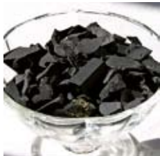
Pierres concassées de schungite pour l'eau

Le contact direct avec l'eau permet l'expression de qualités supplémentaires de la schungite. Lorsque la schungite est en contact avec un récipient, elle transmet son intensité de vie mais elle ne purifie pas l'eau ni ne lui transmet son essence qui est le nanocarbone naturel.