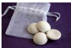
Crystal Pearls Sachet de 4 palets céramique et cristal lamellaire

Oui, nous avons un autre dispositif qui s'appelle les Crystal Pearls . Alors que les cristaux lamellaires agissaient sous forme d'énergie pour les Prills, dans les Pearls, ils vont se retrouver physiquement dans une terre cuite sous la forme de petits palets en céramique.