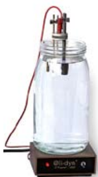
Dynamiseur d'eau OLI-DYN

Le dynamiseur d'eau OLI-DYN permet de rendre une eau vivante en lui apportant un spectre de fréquences très large en ondes biologiques, ces dernières étant le carburant indispensable au fonctionnement optimal des cellules. Cet appareil de grande qualité a été breveté en 1984 et conçu par Jean PAGOT, ingénieur en physique des particules au CNRS, et collaborateur de M.Violet depuis les années 1950 jusqu'en 1970.