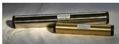
AQUALISEUR sur la photo : Aqualiseur « eau générale », grand et petit modèle.

Nous avons mis au point un système que nous appelons «Aqualiseur» qui fonctionne par résonance. C'est un tube en métal rempli d'un mélange de matériaux informés et dont l'action est pérenne dans le temps. Les Aqualiseurs se placent le long des canalisations d'arrivée d'eau générale, ou bien directement sur les robinets ou les radiateurs pour les petits modèles. Quand l'eau circule, la qualité des substances et des informations qui se trouvent à l'intérieur de l'Aqualiseur est aspirée par le mouvement. L'eau s'en trouve restructurée et informée. Elle libèrera ainsi sa qualité dans votre eau de boisson, de toilette, ou par résonance, dans l'ambiance de votre maison par l'intermédiaire du circuit de chauffage.