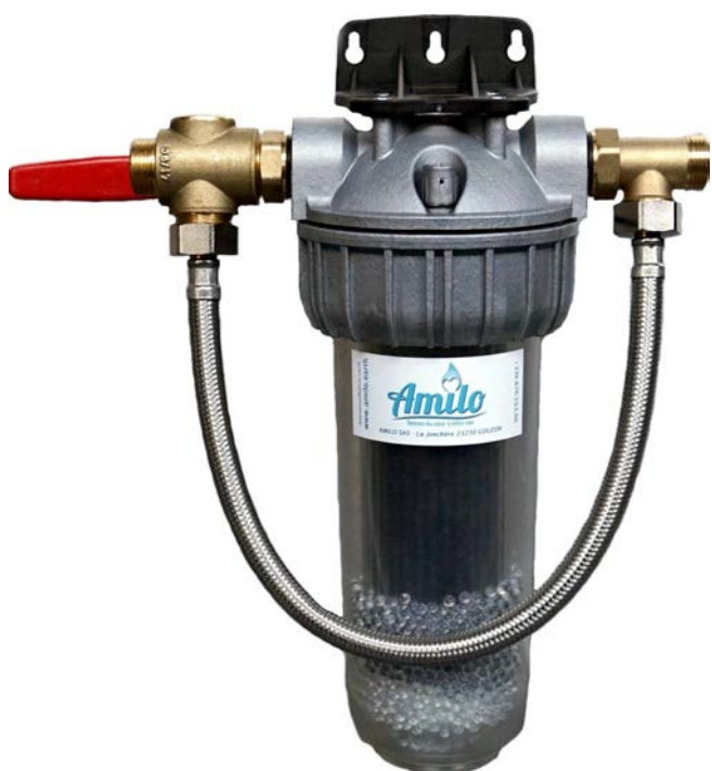
Modèle avec bypass