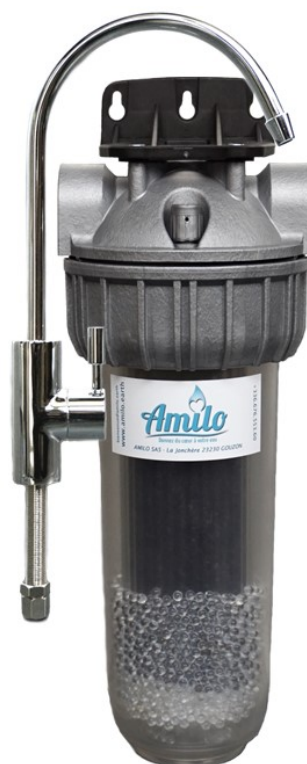
Modèle avec robinet

Prix TTC du modèle avec robinet ou bypass: 287 €