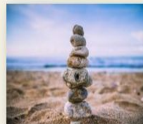
Stages à la Carte