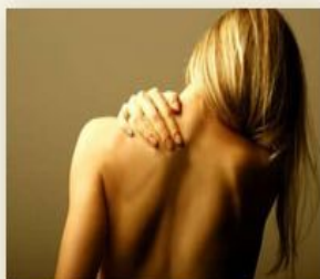
Praticien dans l'Ecoute des « Mots du Corps »