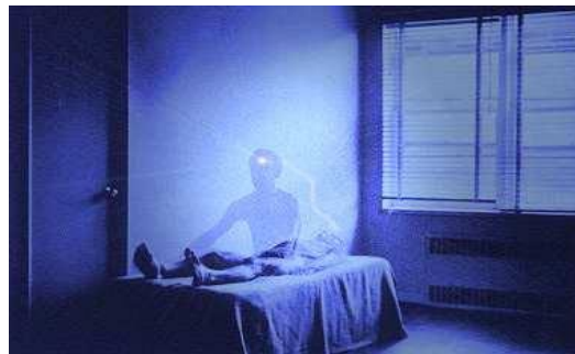
Sortie hors du corps