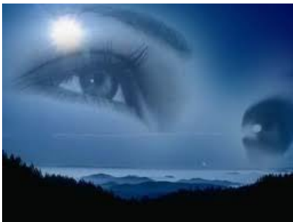
Vision à distance

Au fil de votre pratique, vous trouverez de nombreuses autres applications. Vous apprendrez à tirer profit de vos facultés ignorées et à révéler l'extraordinaire potentiel que recèle votre subconscient.