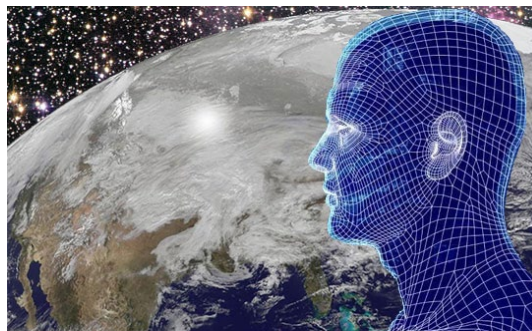
Contact avec la mémoire universelle