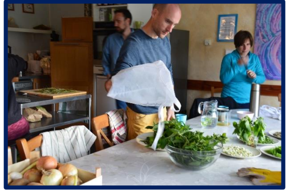
Stage Cueillette et cuisine de plantes sauvages

M. W. – Effectivement, Les Passeurs du Vent, c’est aussi une offre de stages de bien-être et d’évolution proposés par différents intervenants. Retraite de yoga, séjour de jeûne, cueillette et cuisine de plantes sauvages, chamanisme, Biodanza, Danse des 5 Rythmes... Les pratiques thérapeutiques et de bien-être qui se vivent ici sont variées. Nos salles de séminaire et nos gîtes accueillent intervenants et stagiaires à l’année. Comme fondateur du centre, je privilégie les approches qui s’inscrivent dans un développement personnel ou spirituel, question d’aider l’Autre à toujours ouvrir de nouvelles portes sur la vie. C’est dans l’ADN des Passeurs du Vent.